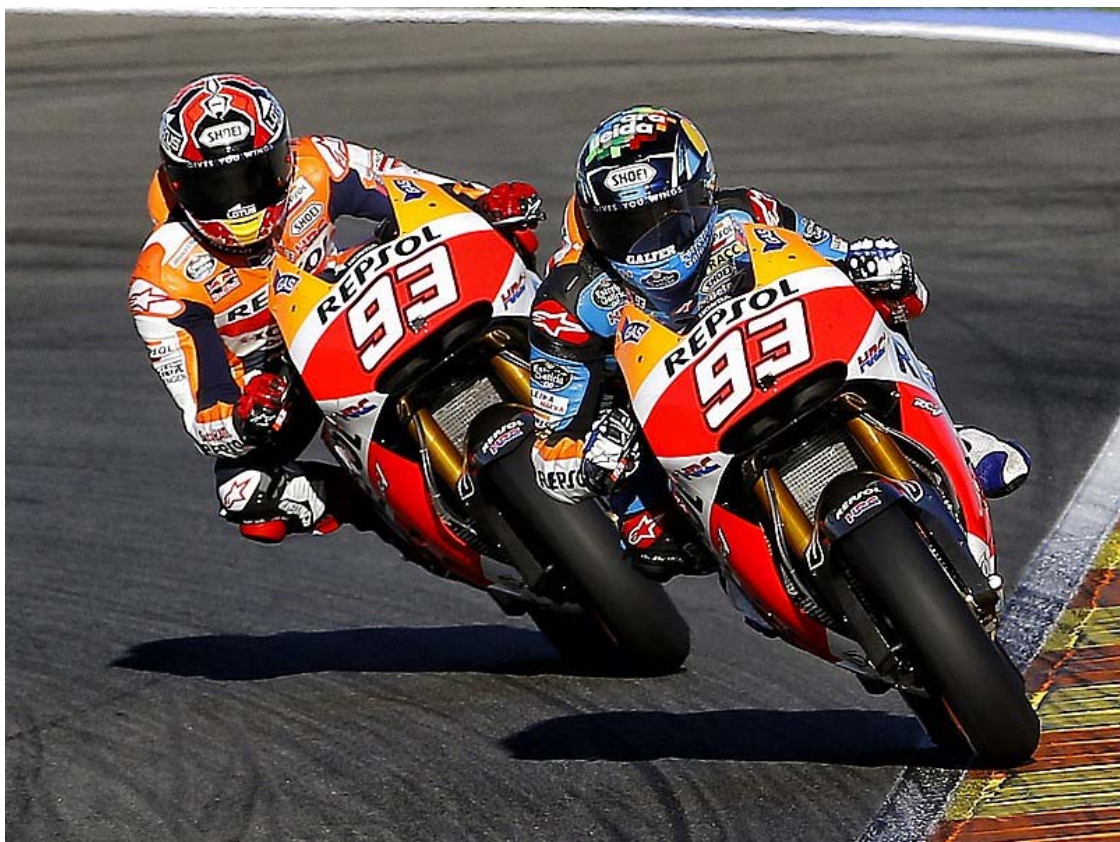
Figura 1 Motociclismo de Velocidad 1

El Motociclismo de Velocidad es una modalidad del motociclismo disputada en circuitos de carreras, pistas o rutas pavimentadas, cuyo objetivo suele ser el recorrer la mayor distancia en una cantidad de tiempo específica, o una determinada distancia en el menor tiempo posible, o aun que puede haber otras modalidades.