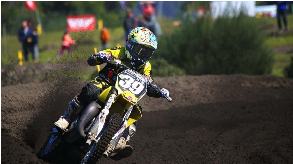
Figura 1 Motocross 2

El Motocross es una modalidad de motociclismo que consiste en competir en velocidad por terrenos al aire libre muy accidentados (con desniveles, ríos, caminos pedregosos o embarrados); las competiciones constan de dos mangas, que se disputan en el mismo circuito y el mismo día.