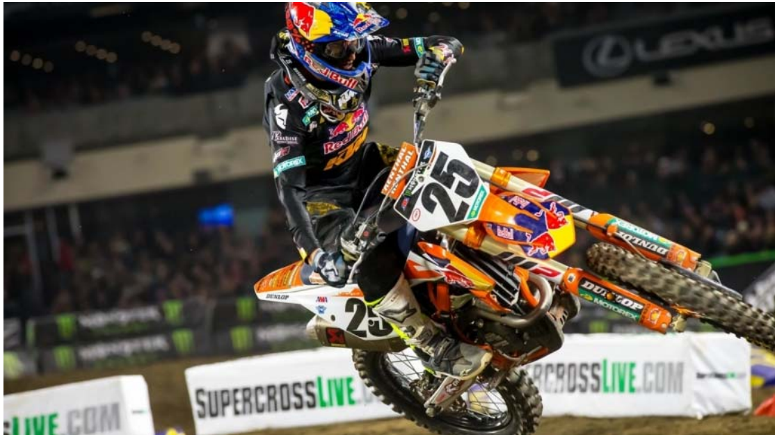
Figura 1 Supercross 3

El Supercross es una modalidad de motociclismo derivada del motocross. Cada carrera está compuesta por un sistema de eliminatorias hasta llegar a una final. Las mangas clasificatorias son más cortas y los circuitos son mucho más pequeños e intensos que en el motocross.