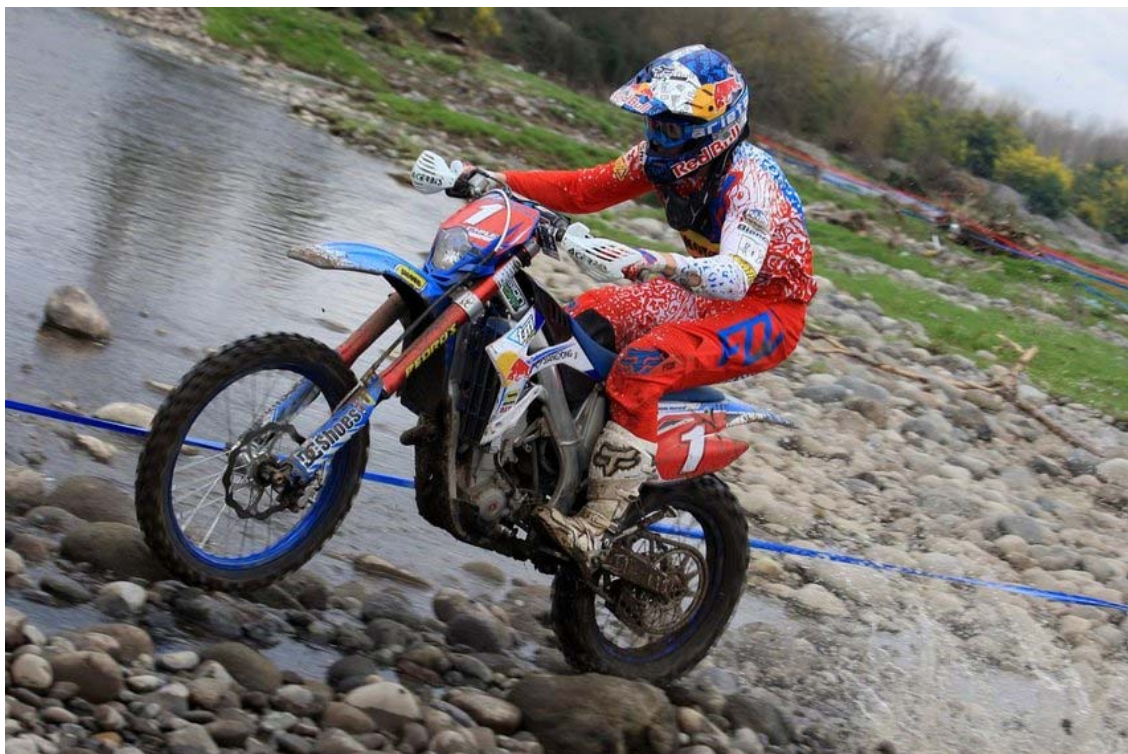
Figura 1 Enduro 6

El Enduro es una modalidad del motociclismo que consiste en realizar carreras por terrenos naturales muy accidentados y especialmente elegidos para probar la resistencia de los pilotos.