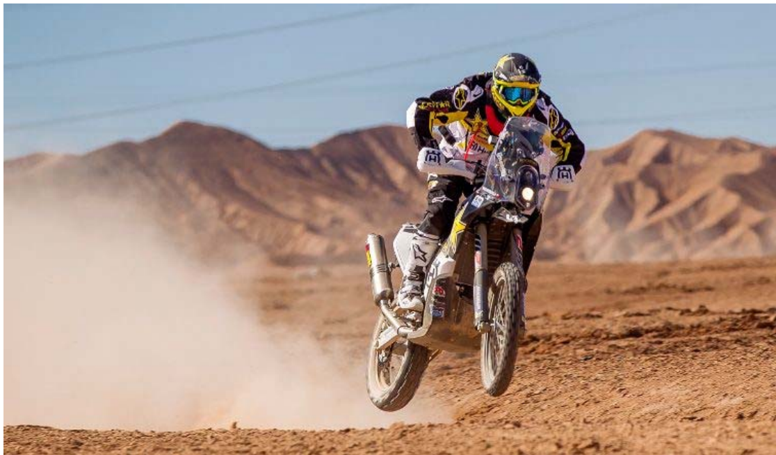
Figura 1 Rally Cross Country 10

Los participantes deben soportar calor intenso, arena y viento, teniendo que poder atravesar obstáculos importantes, a veces incluso el vehículo puede quedarse clavado en la arena por lo que es importante llevar las herramientas necesarias para sacarlo.